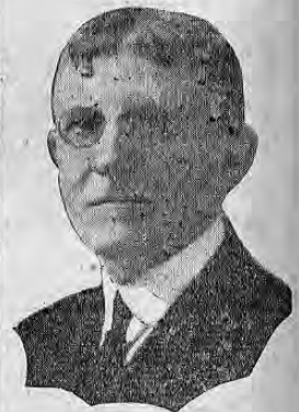
HON. EDWARD ALBRIGHT

EL SENADO APROBO AYER EL NOMBRAMIENTO DE MR. ALBRIGHT