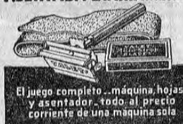
El juego completo... máquina, hojas y afeitador, todo al precio corriente de una máquina sola

Ninguna hoja afeitada tan bien como la que es ASENTADA DIARIAMENTE