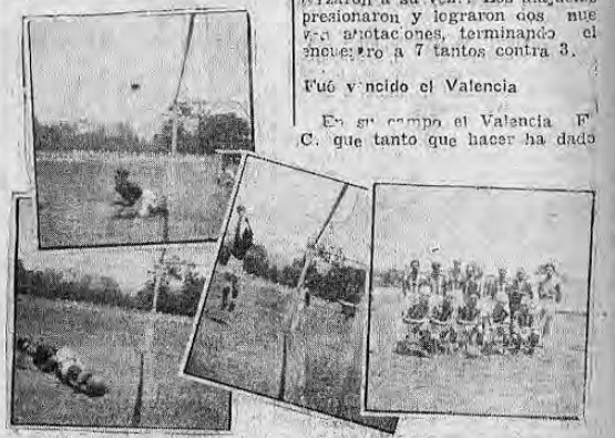
Tres aspectos del encuentro del domingo en el Estadio — A la derecha: el Barcelona Jr. que fue derrotado por la Liga Deportiva Alajuelense

Con asistencia de un buen número de elementos de Puntarenas y de Alajuela, así como parte del grupo de fanáticos de esta capital, se verificó el domingo a las 10.30 el anunciado match de revancha Barcelona Jr. y Liga Deportiva Alajuelense.